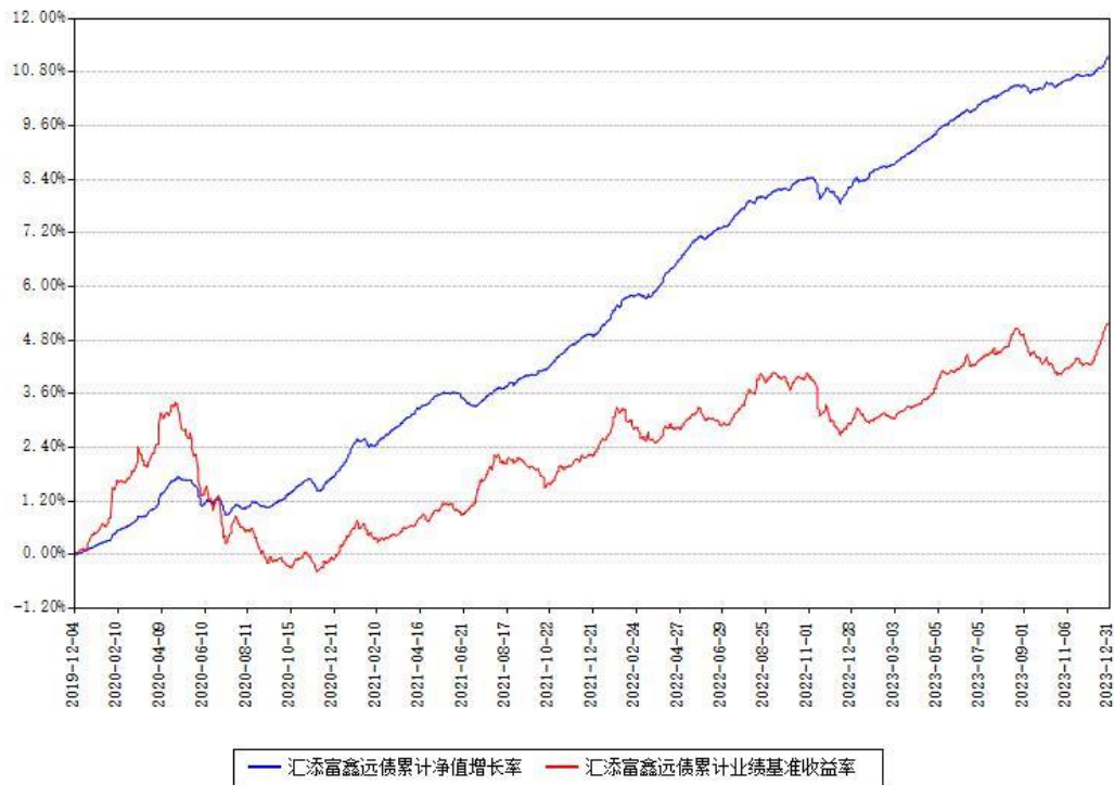
汇添富鑫远债累计净值增长率与同期业绩基准收益率对比图

注：本基金建仓期为本《基金合同》生效之日（2019年12月04日）起6个月，建仓期结束时各项资产配置比例符合合同约定。