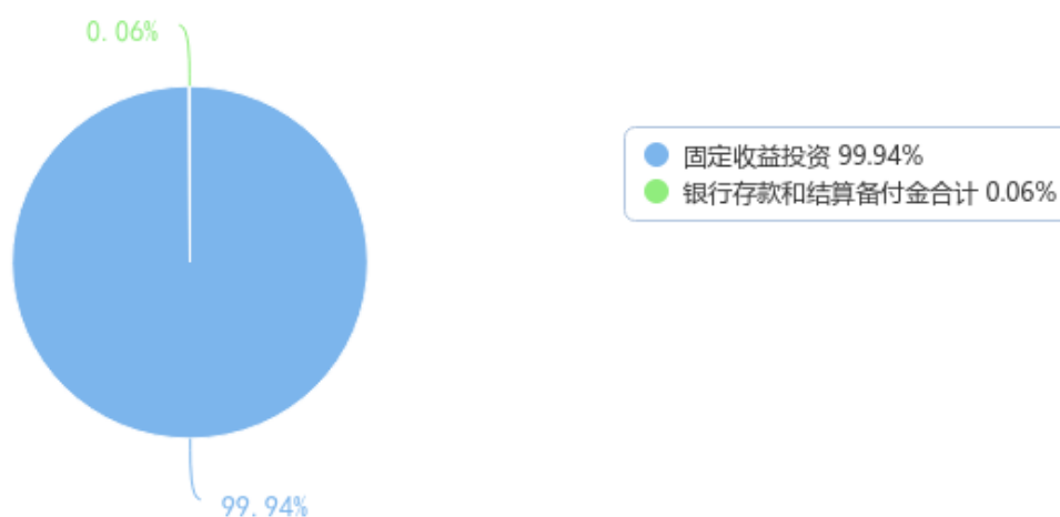
投资组合资产配置图表 (数据截至日期: 2024年03月31日)