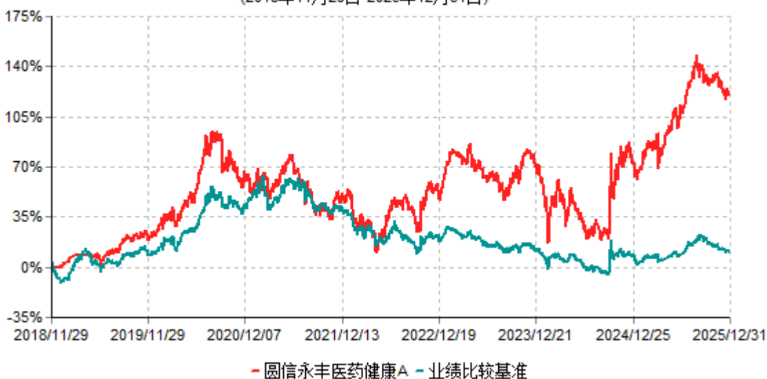
圆信永丰医药健康A累计净值增长率与业绩比较基准收益率历史走势对比图 (2018年11月29日-2025年12月31日)