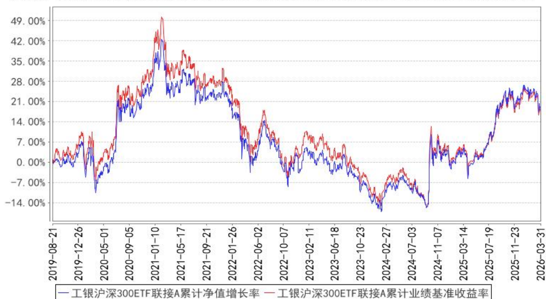
工银沪深300ETF联接A累计净值增长率与同期业绩比较基准收益率的历史走势对比图