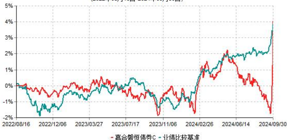
嘉合磐恒债券C累计净值增长率与业绩比较基准收益率历史走势对比图 (2022年08月16日-2024年09月30日)