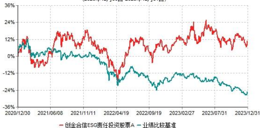
创金合信 ESG 责任投资股票 A 累计净值增长率与业绩比较基准收益率历史走势对比图 (2020年12月30日-2023年12月31日)