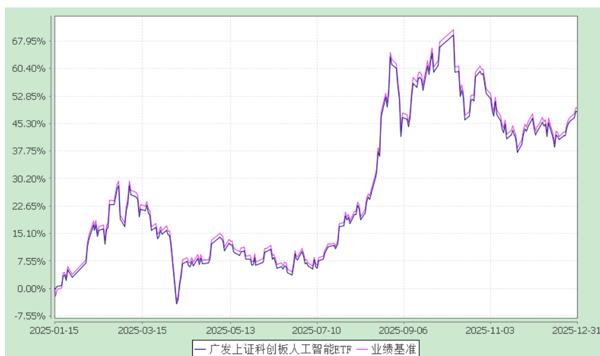
广发上证科创板人工智能交易型开放式指数证券投资基金 份额累计净值增长率与业绩比较基准收益率的历史走势对比图 (2025 年 1 月 15 日至 2025 年 12 月 31 日)

注：（1）本基金合同生效日期为 2025 年 1 月 15 日，至披露时点未满一年。