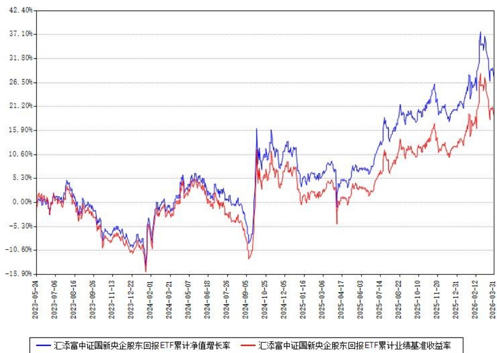
汇添富中证国新央企股东回报ETF累计净值增长率与同期业绩基准收益率对比图