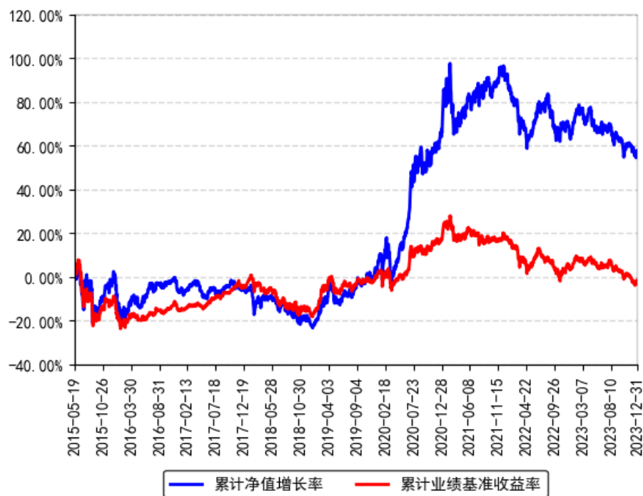
南方改革机遇灵活配置混合累计净值增长率与同期业绩比较基准收益率的历史走势对比图