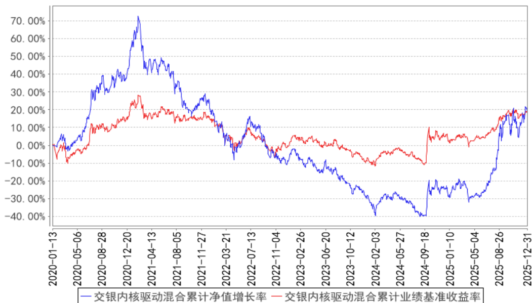
交银内核驱动混合累计净值增长率与同期业绩比较基准收益率的历史走势对比图

注：本基金建仓期为自基金合同生效日起的 6 个月。截至建仓期结束，本基金各项资产配置比例符合基金合同及招募说明书有关投资比例的约定。