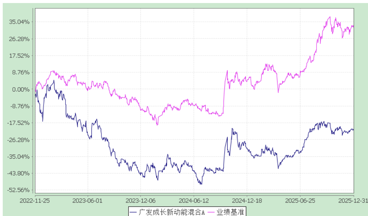
广发成长新动能混合 C