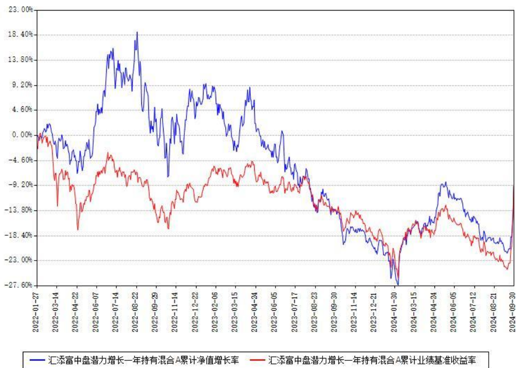
汇添富中盘潜力增长一年持有混合A累计净值增长率与同期业绩基准收益率对比图