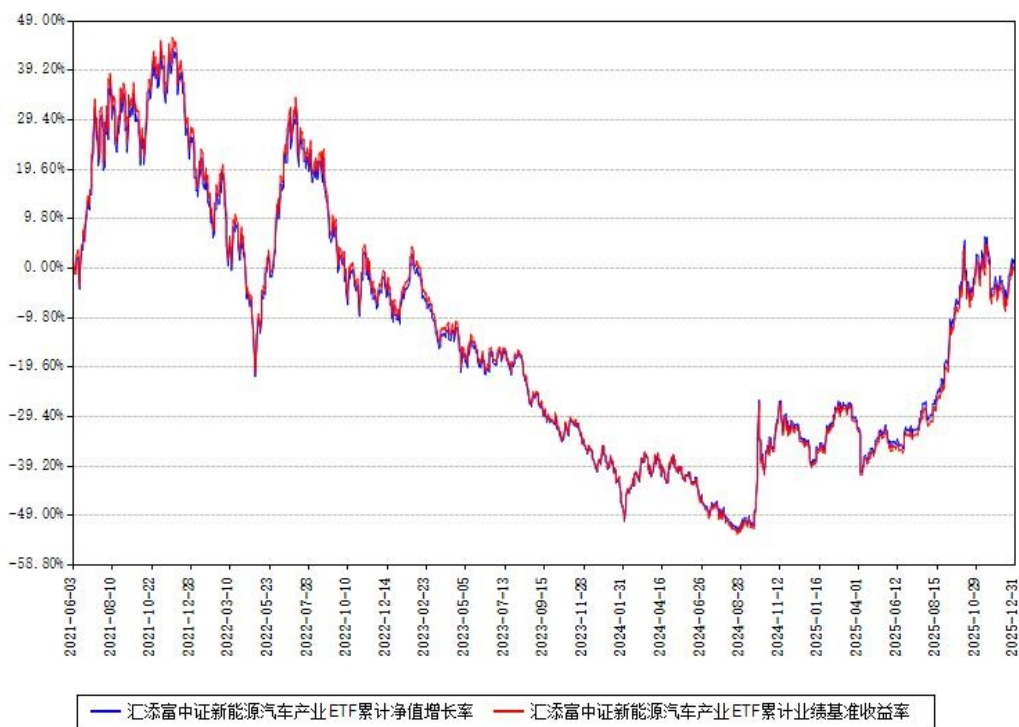
汇添富中证新能源汽车产业ETF累计净值增长率与同期业绩比较基准收益率对比图

注：本基金建仓期为本《基金合同》生效之日（2021年06月03日）起6个月，建仓期结束时各项资产配置比例符合合同约定。