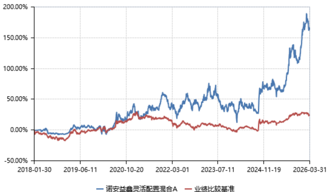
诺安益鑫灵活配置混合 C