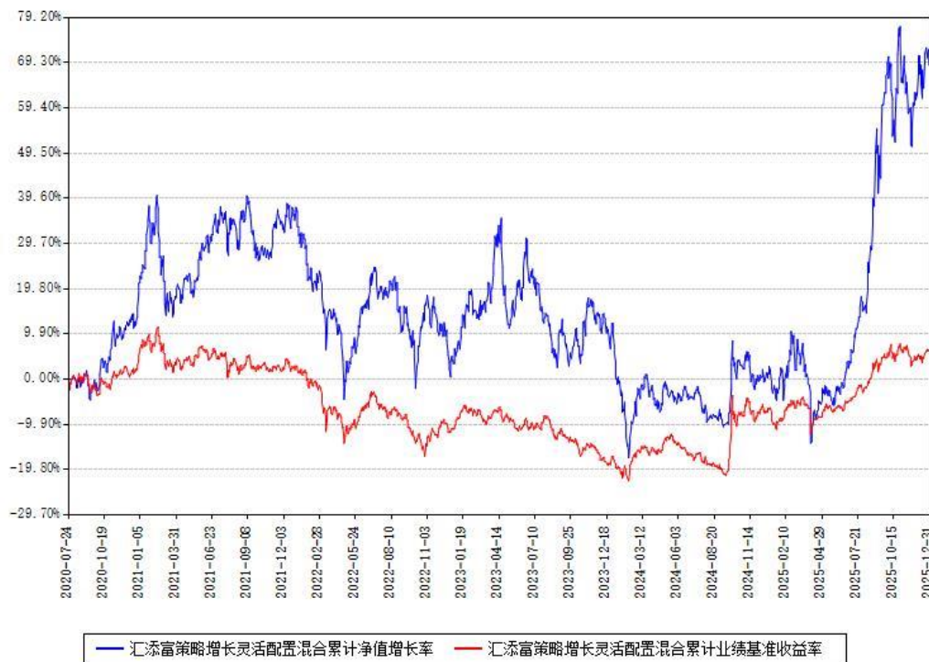
汇添富策略增长灵活配置混合累计净值增长率与同期业绩比较基准收益率对比图

注：本基金建仓期为本《基金合同》生效之日（2020年07月24日）起6个月，建仓期结束时各项资产配置比例符合合同约定。