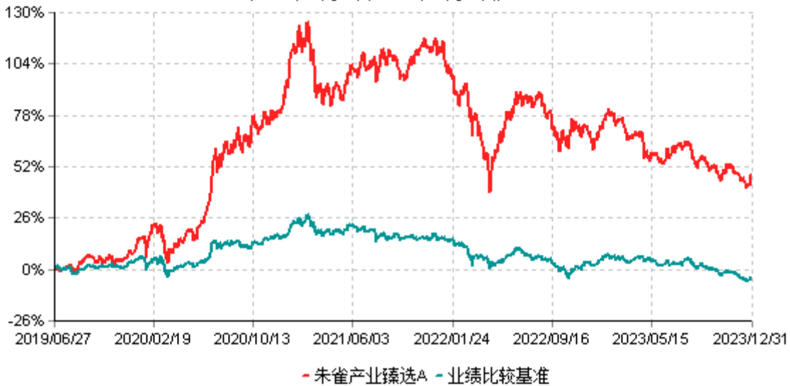
朱雀产业臻选A累计净值增长率与业绩比较基准收益率历史走势对比图 (2019年06月27日-2023年12月31日)