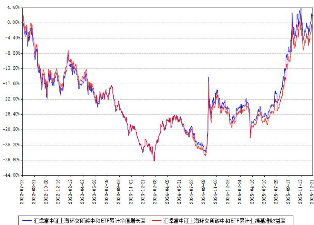
汇添富中证上海环交所碳中和ETF累计净值增长率与同期业绩比较基准收益率对比图

注：本基金建仓期为本《基金合同》生效之日（2022年07月13日）起6个月，建仓期结束时各项资产配置比例符合合同约定。