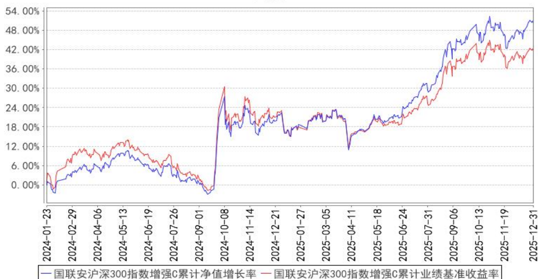
国联安沪深300指数增强C累计净值增长率与同期业绩比较基准收益率的历史走势对比图