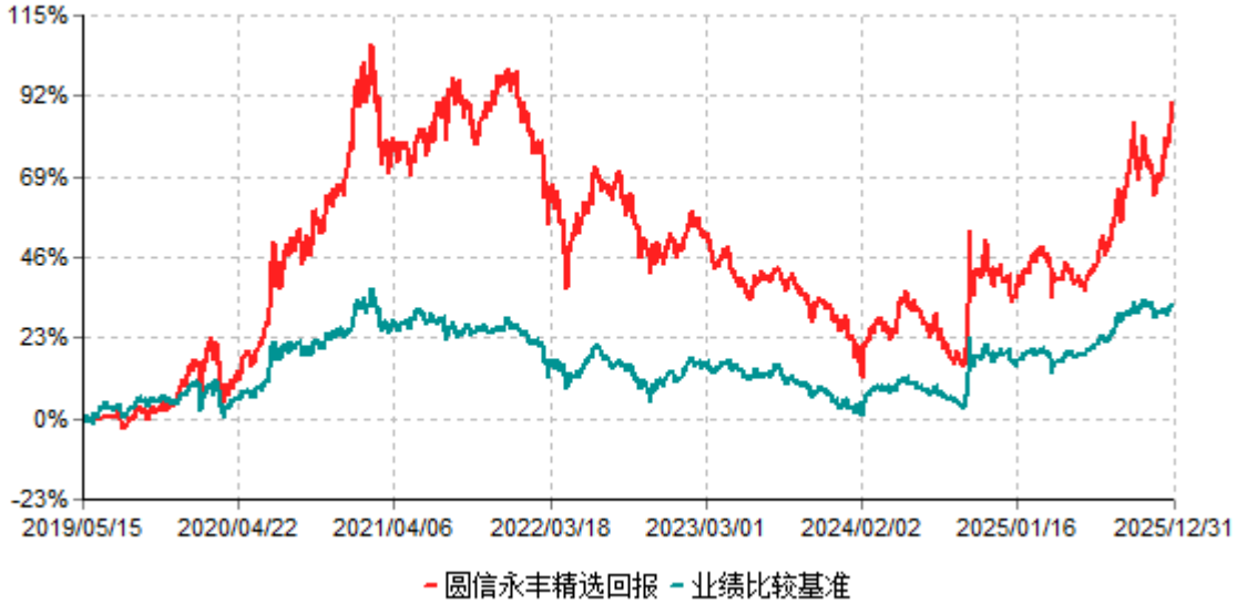
圆信永丰精选回报累计净值增长率与业绩比较基准收益率历史走势对比图 (2019年05月15日-2025年12月31日)