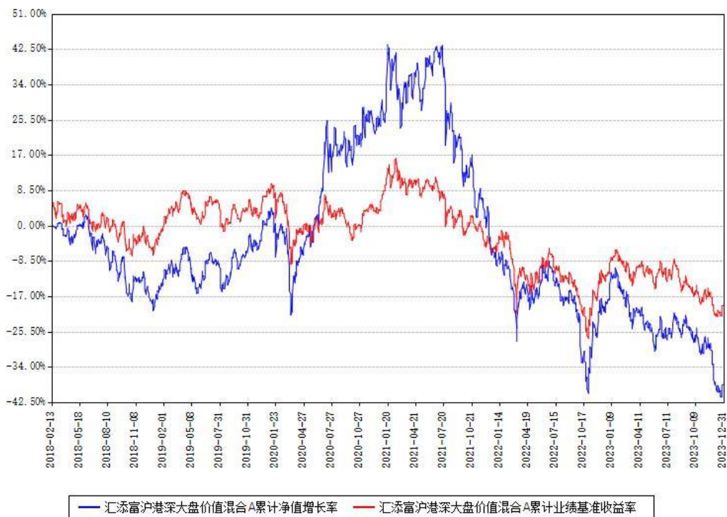
汇添富沪港深大盘价值混合A累计净值增长率与同期业绩基准收益率对比图

(二) 自基金合同生效以来基金累计净值增长率变动及其与同期业绩比较基准收益率变动的比较图