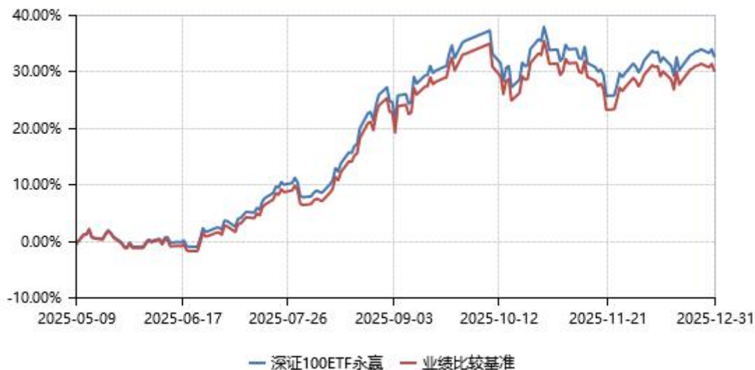
永赢深证100交易型开放式指数证券投资基金累计净值收益率与业绩比较基准收益率历史走势对比图 (2025年05月09日-2025年12月31日)

注：本基金于 2025 年 05 月 09 日由永赢深证创新 100 交易型开放式指数证券投资基金转型而成，截至本报告期末，本基金转型未满一年。