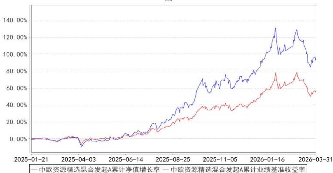
中欧资源精选混合发起A累计净值增长率与同期业绩比较基准收益率的历史走势对比图

注：本基金基金合同生效日期为 2025 年 1 月 21 日，自基金合同生效日起到本报告期末不满一年，按基金合同的规定，本基金自基金合同生效起六个月为建仓期，建仓期结束时各项资产配置比例已经符合基金合同约定。