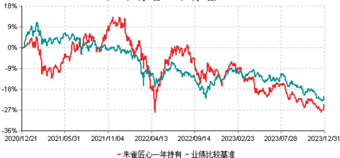
朱雀匠心一年持有期混合型证券投资基金累计净值增长率与业绩比较基准收益率历史走势对比图 (2020年12月21日-2023年12月31日)