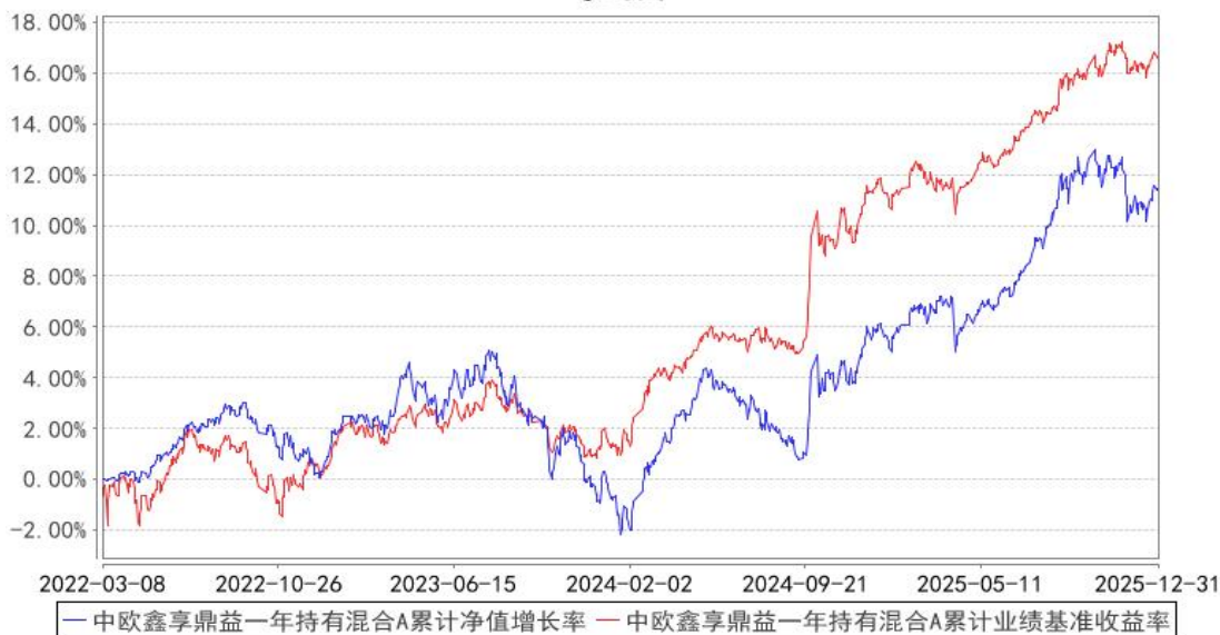
中欧鑫享鼎益一年持有混合A累计净值增长率与同期业绩比较基准收益率的历史走势对比图