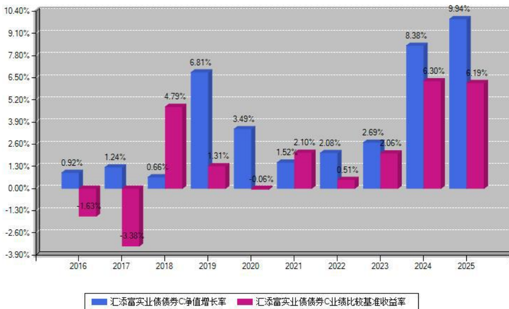
汇添富实业债债券C每年净值增长率与同期业绩基准收益率对比图

注：数据截止日期为2025年12月31日，基金的过往业绩不代表未来表现。本《基金合同》生效之日为2013年06月14日，合同生效当年按实际存续期计算，不按整个自然年度进行折算。