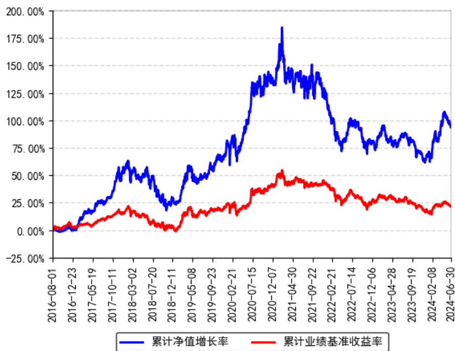
南方品质优选灵活配置混合A累计净值增长率与同期业绩比较基准收益率的历史走势对比图