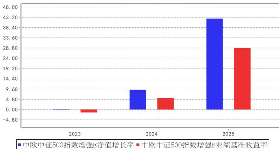
中欧中证500指数增强E基金每年净值增长率与同期业绩比较基准收益率的对比图

注：2023 年 11 月 1 日本基金新增 E 份额，2023 年度数据为 2023 年 11 月 2 日至 2023 年 12 月 31 日数据。