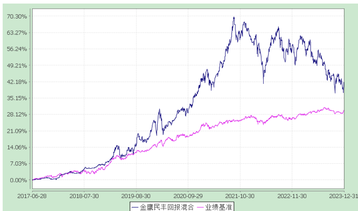
金鹰民丰回报定期开放混合型证券投资基金 份额累计净值增长率与业绩比较基准收益率历史走势对比图 (2017 年 6 月 28 日至 2023 年 12 月 31 日)