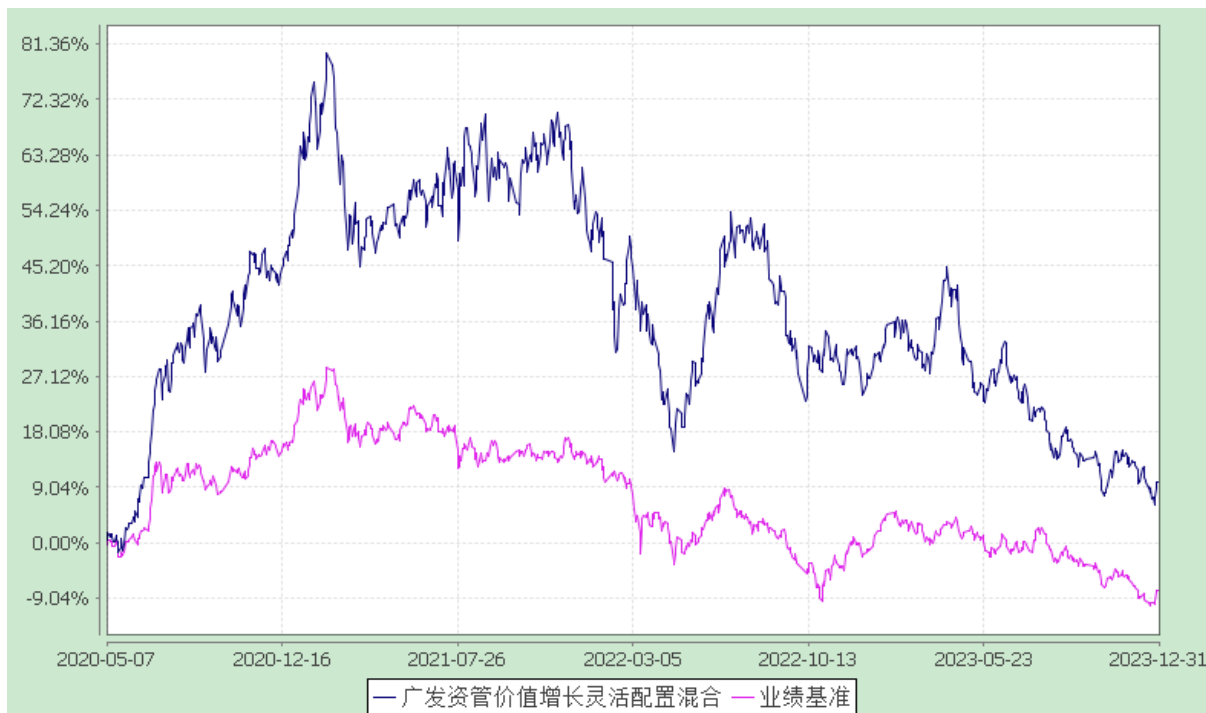
广发资管价值增长灵活配置混合型集合资产管理计划 份额累计净值增长率与业绩比较基准收益率历史走势对比图 (2020年5月7日至2023年12月31日)