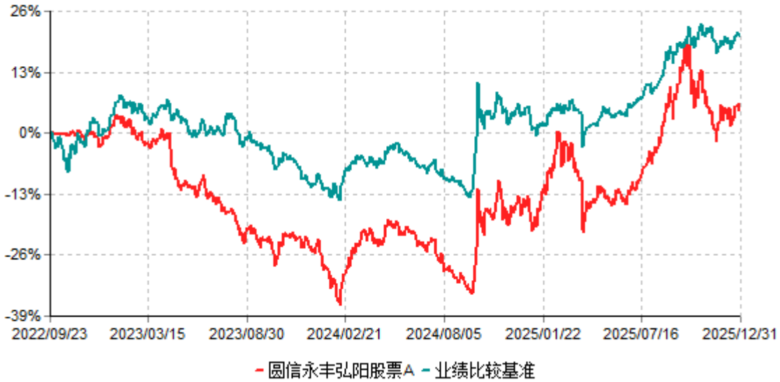
圆信永丰弘阳股票A累计净值增长率与业绩比较基准收益率历史走势对比图 (2022年09月23日-2025年12月31日)