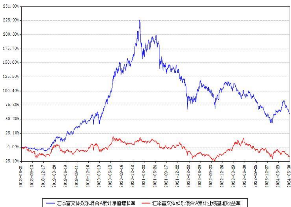
汇添富文体娱乐混合A累计净值增长率与同期业绩比较基准收益率对比图