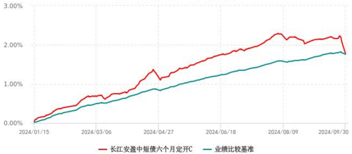
长江安盈中短债六个月定开C累计净值增长率与业绩比较基准收益率历史走势对比图 (2024年01月15日-2024年09月30日)

注：本基金C类份额“自基金合同生效以来”的报告期为2024年01月15日至2024年09月30日。