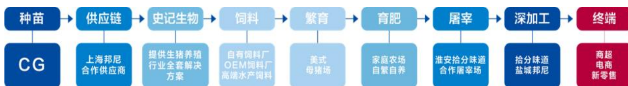
(图为公司全产业链协同发展布局)

报告期内公司主营业务和产品未发生重大变化，公司继续以生鲜猪肉及肉制品为主体进行产业链的搭建和完善。