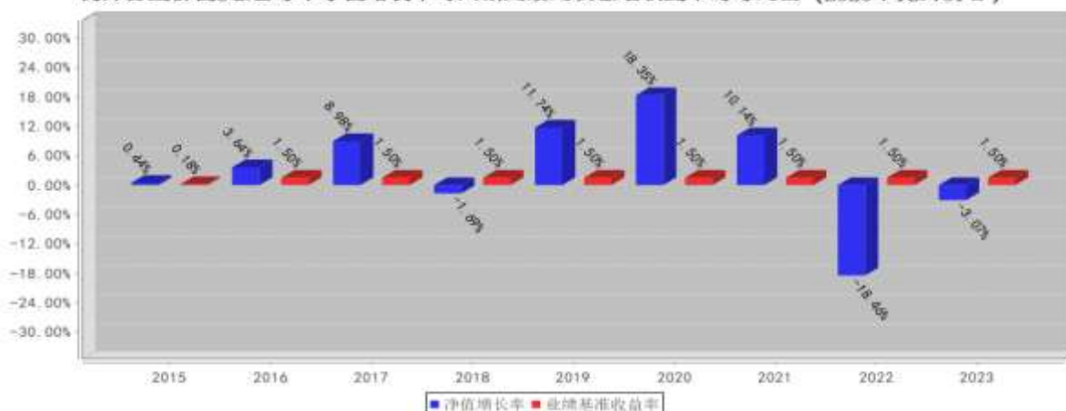
德邦鑫星价值C基金每年净值增长率与同期业绩比较基准收益率的对比图 (2023年12月31日)

注：1. 基金合同生效当年按实际期限计算，不按整个自然年度折算。 2. 基金过往业绩不代表未来表现。