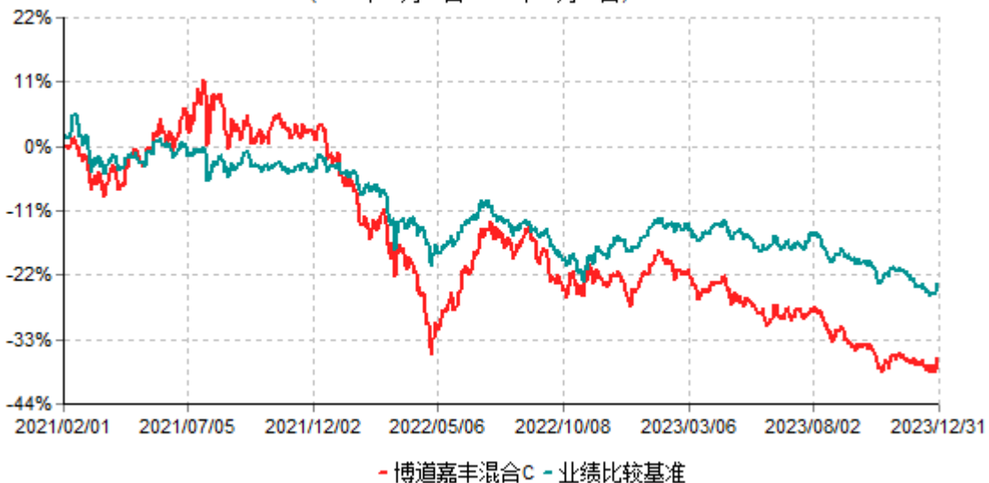
博道嘉丰混合C累计净值增长率与业绩比较基准收益率历史走势对比图 (2021年02月01日-2023年12月31日)

注：本基金建仓期为自基金合同生效日起的6个月。截至建仓期结束，本基金各项资产配置比例符合基金合同及招募说明书有关投资比例的约定。