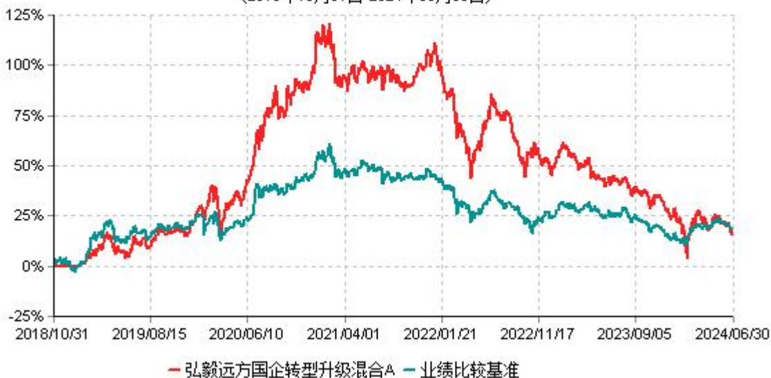
弘毅远方国企转型升级混合A累计净值增长率与业绩比较基准收益率历史走势对比图 (2018年10月31日-2024年06月30日)