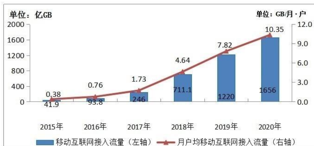
▲ 2015-2020 年移动互联网流量及月 DOU 增长情况

随着“互联网+”时代的到来，我国互联网基础资源进一步丰富，网站数量出现了迅猛的增长，APP等智能应用数量也呈现出爆发式增加，根据工信部数据，截至2020年底，我国国内市场上监测到的APP数量为345万款。2020年，移动互联网接入流量消费达到1656亿GB，比上年增长35.7%。全年移动互联网月户均流量（DOU）达10.35GB/户·月，比上年增长32%。