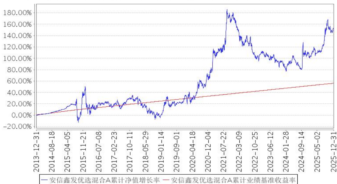
安信鑫发优选混合A累计净值增长率与同期业绩比较基准收益率的历史走势对比图