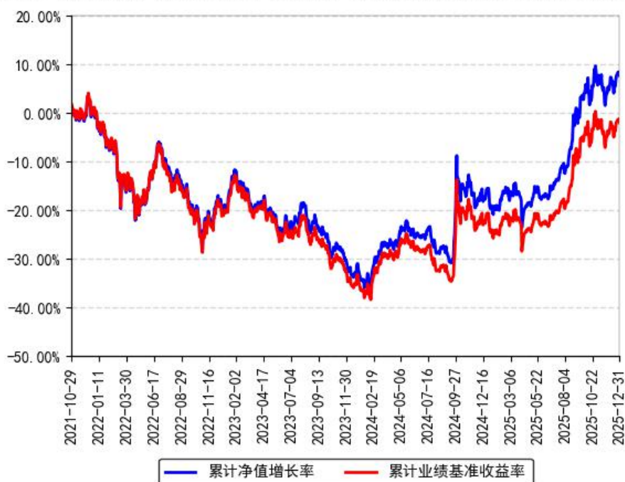
南方MSCI中国A50互联互通ETF累计净值增长率与同期业绩比较基准收益率的历史走势对比图