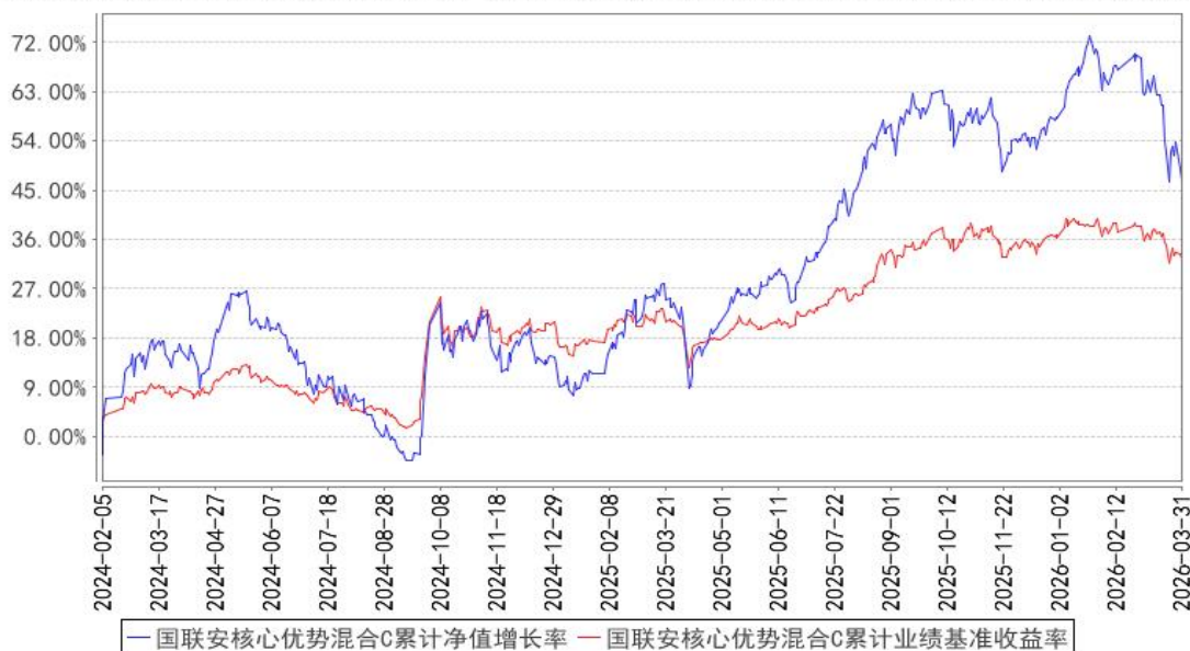
国联安核心优势混合C累计净值增长率与同期业绩比较基准收益率的历史走势对比图

注：1、国联安核心优势混合型证券投资基金于 2023 年 12 月 5 日起增加收取销售服务费的 C 类基金份额，并对本基金基金合同及托管协议作相应修改，原有的基金份额在增加收取销售服务费的 C 类基金份额后，全部转换为国联安核心优势混合型证券投资基金 A 类份额；