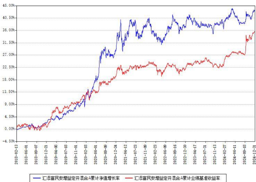
汇添富民安增益定开混合A累计净值增长率与同期业绩基准收益率对比图

(二)自基金合同生效以来基金累计净值增长率变动及其与同期业绩比较基准收益率变动的比较图