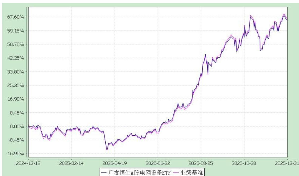
广发恒生 A 股电网设备交易型开放式指数证券投资基金 份额累计净值增长率与业绩比较基准收益率的历史走势对比图 (2024 年 12 月 12 日至 2025 年 12 月 31 日)

注：本基金建仓期为基金合同生效后 6 个月，建仓期结束时各项资产配置比例符合本基金合同有关规定。