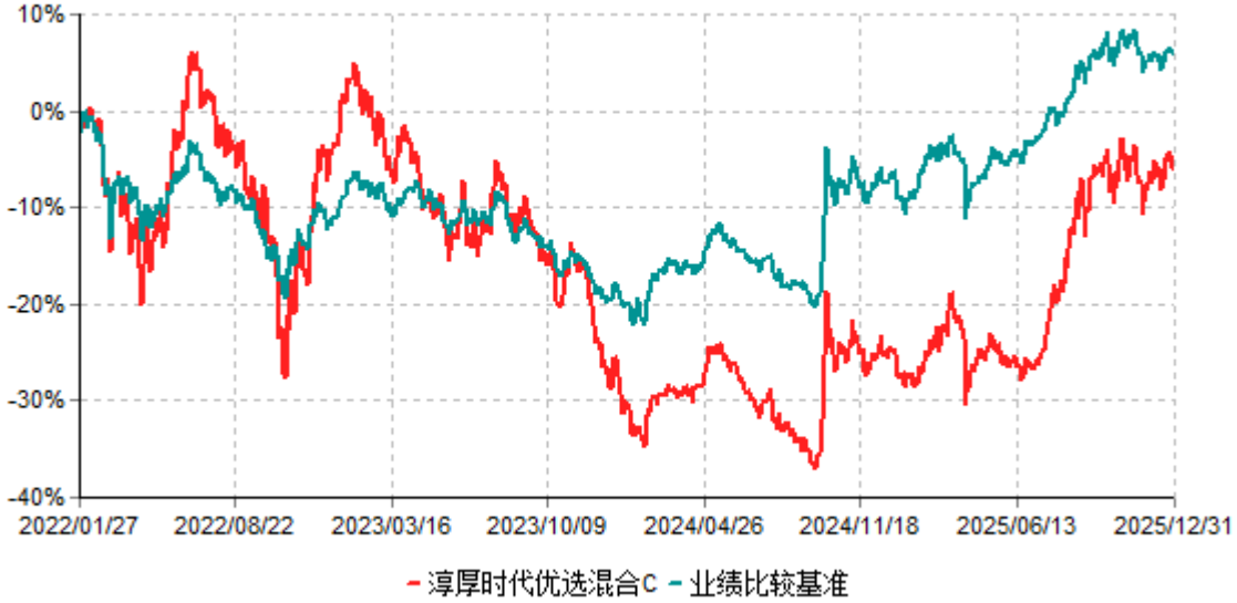
淳厚时代优选混合C累计净值增长率与业绩比较基准收益率历史走势对比图 (2022年01月27日-2025年12月31日)

注：本基金基金合同生效日为2022年1月27日。按基金合同规定，本基金自基金合同生效起6个月内为建仓期。建仓期结束时本基金的各项投资比例均符合基金合同约定。