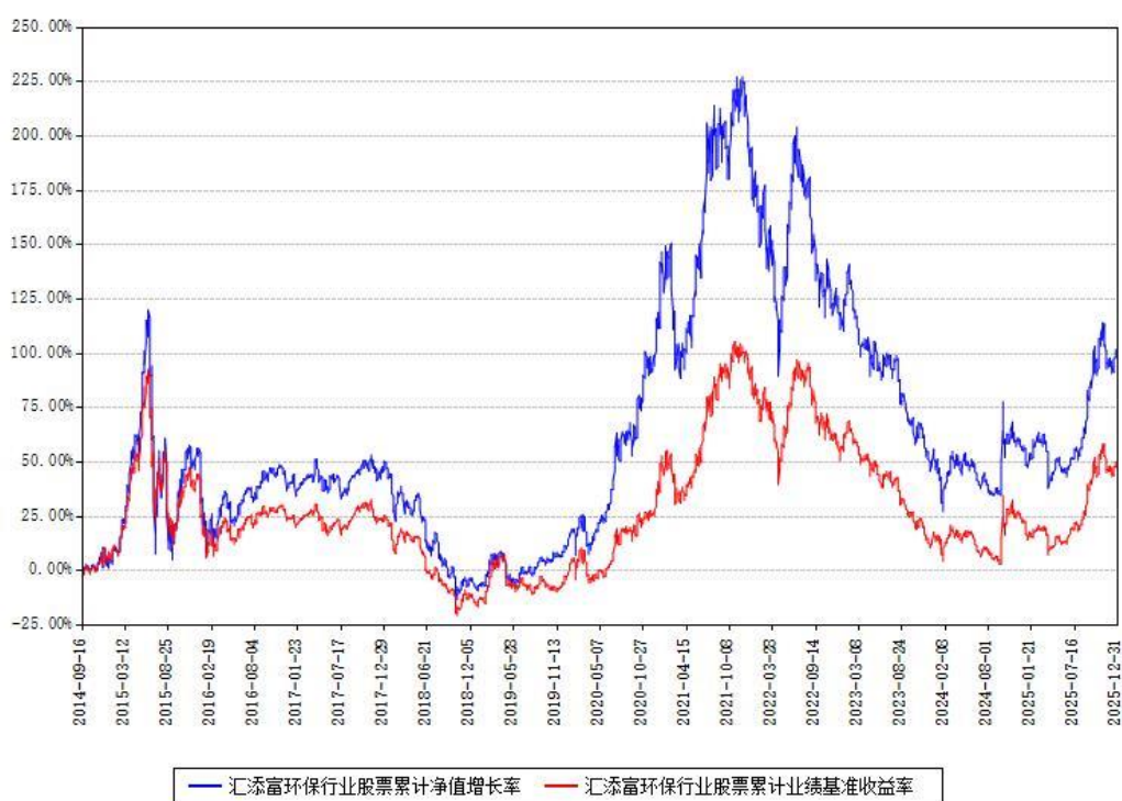
汇添富环保行业股票累计净值增长率与同期业绩基准收益率对比图

注：本基金建仓期为本《基金合同》生效之日（2014年09月16日）起6个月，建仓期结束时各项资产配置比例符合合同约定。