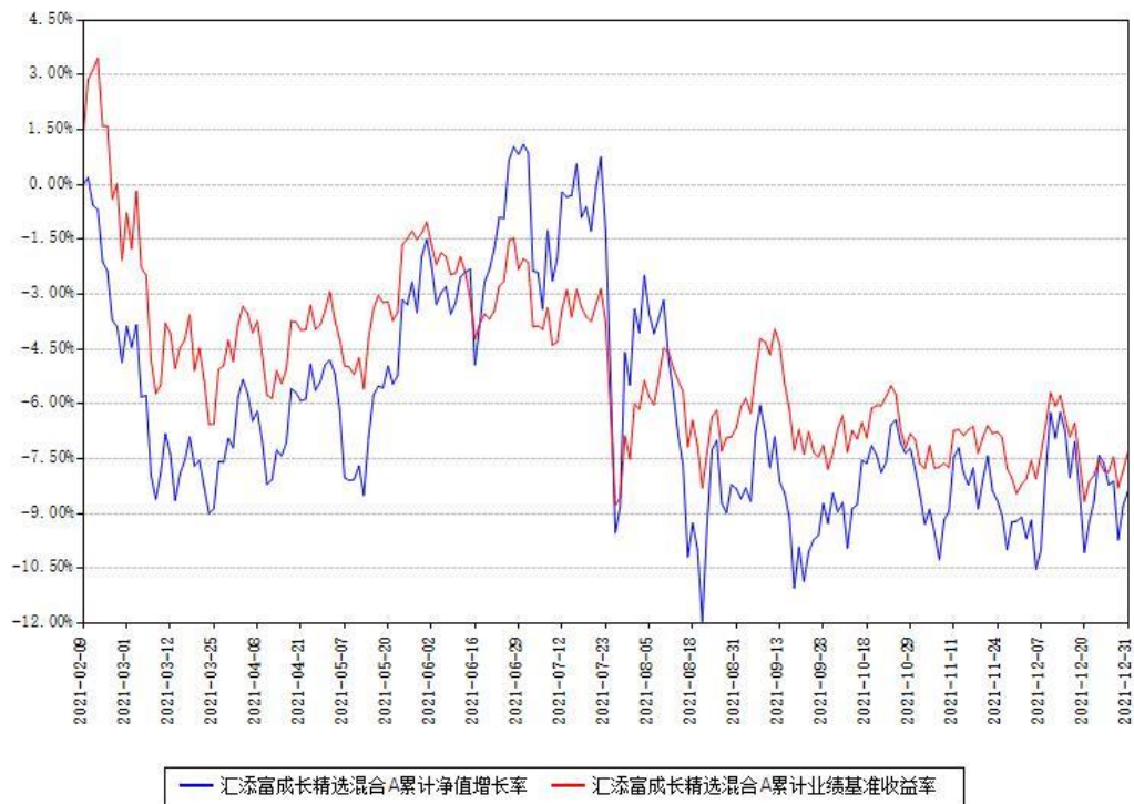
汇添富成长精选混合A累计净值增长率与同期业绩比较基准收益率对比图