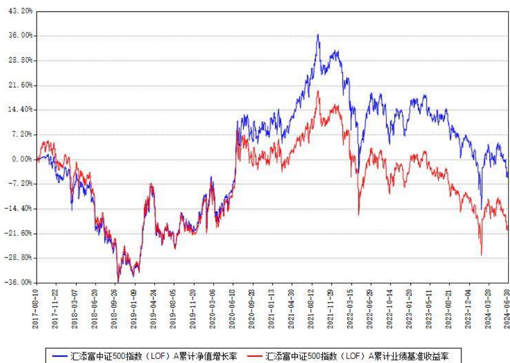
汇添富中证500指数 (LOF) A 累计净值增长率与同期业绩基准收益率对比图