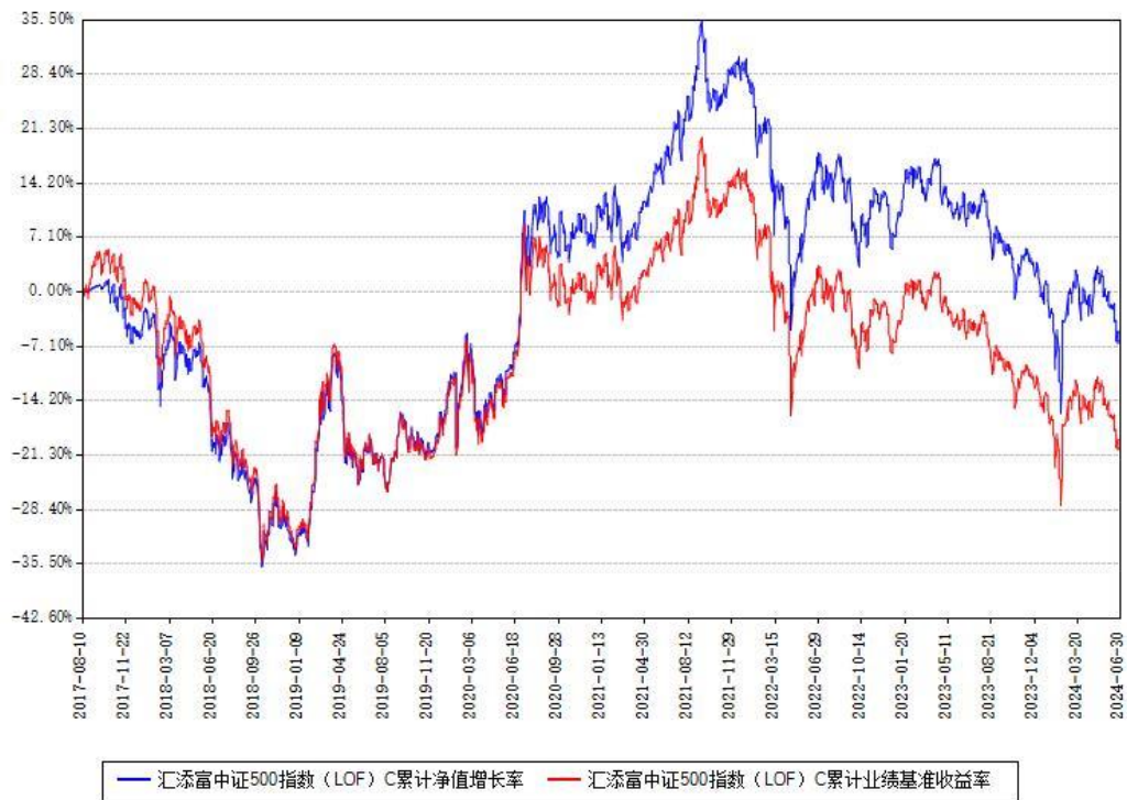
汇添富中证500指数 (LOF) C 累计净值增长率与同期业绩基准收益率对比图