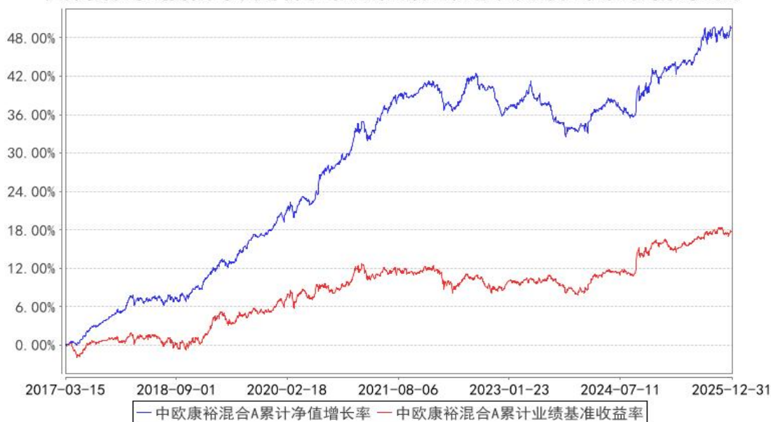
中欧康裕混合A累计净值增长率与同期业绩比较基准收益率的历史走势对比图