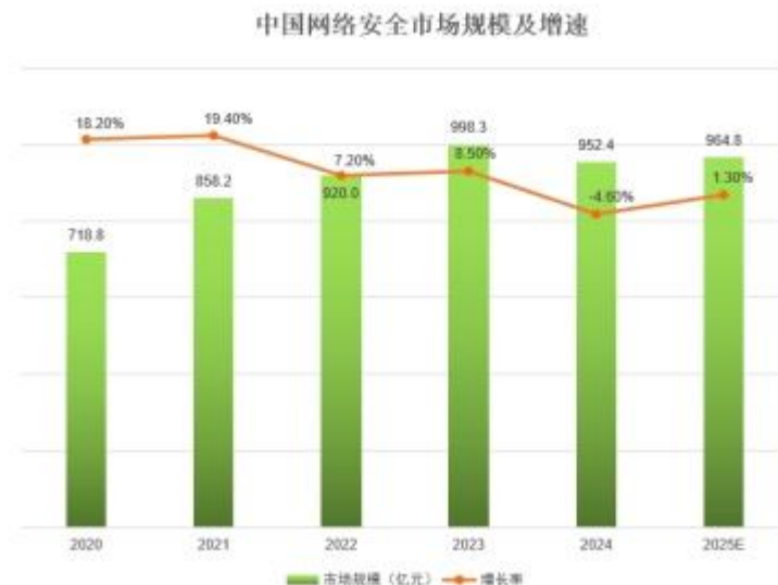
图 4 中国网络安全市场规模及增速