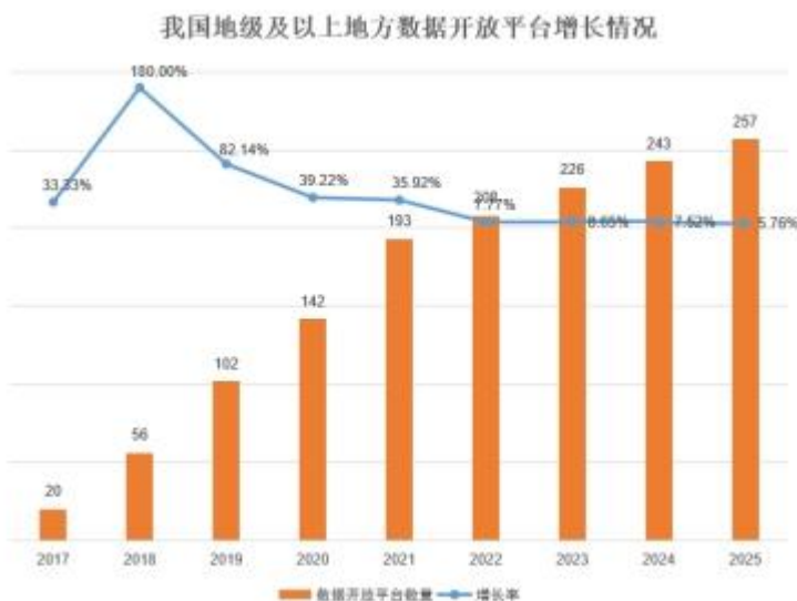
图 3 我国地级及以上地方数据开放平台增长情况

根据复旦大学和国家信息中心数字中国研究院联合发布的《中国地方公共数据开放利用报告》，近年来我国各地方政府上线的数据开放平台数量持续上升。截至 2025 年 7 月，我国 27 个省级行政区（不含直辖市和港澳台）中已有 26 个上线了公共数据开放平台，占总数的 96%。257 个省级和城市的地方政府上线了数据开放平台，其中省级平台 26 个，城市平台 231 个。与 2024 年同期相比，新增 14 个地方平台，其中包含 2 个省级平台和 12 个城市平台，平台总数增长约 5%。