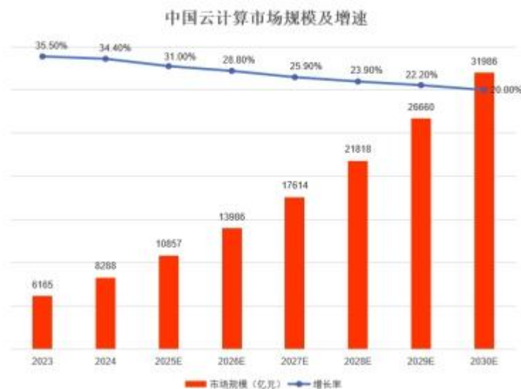
图 2 中国云计算市场规模及增速

在政策的引领下，我国持续推动云计算由基础应用向新技术融合发展转变，不断加深拓展行业应用的深度。根据中国信通院统计，2024 年我国云计算市场规模达到 8,288 亿元，较 2023 年增长 34.4%，随着人工智能、量子计算等技术与云计算的深度融合，预计“十五五”期间，云计算市场规模增速将保持在 20%以上，预计到 2030 年我国云计算市场规模有望突破 3 万亿元。