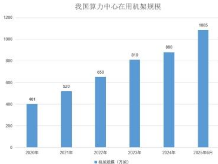
图 1 我国算力中心在用机架规模