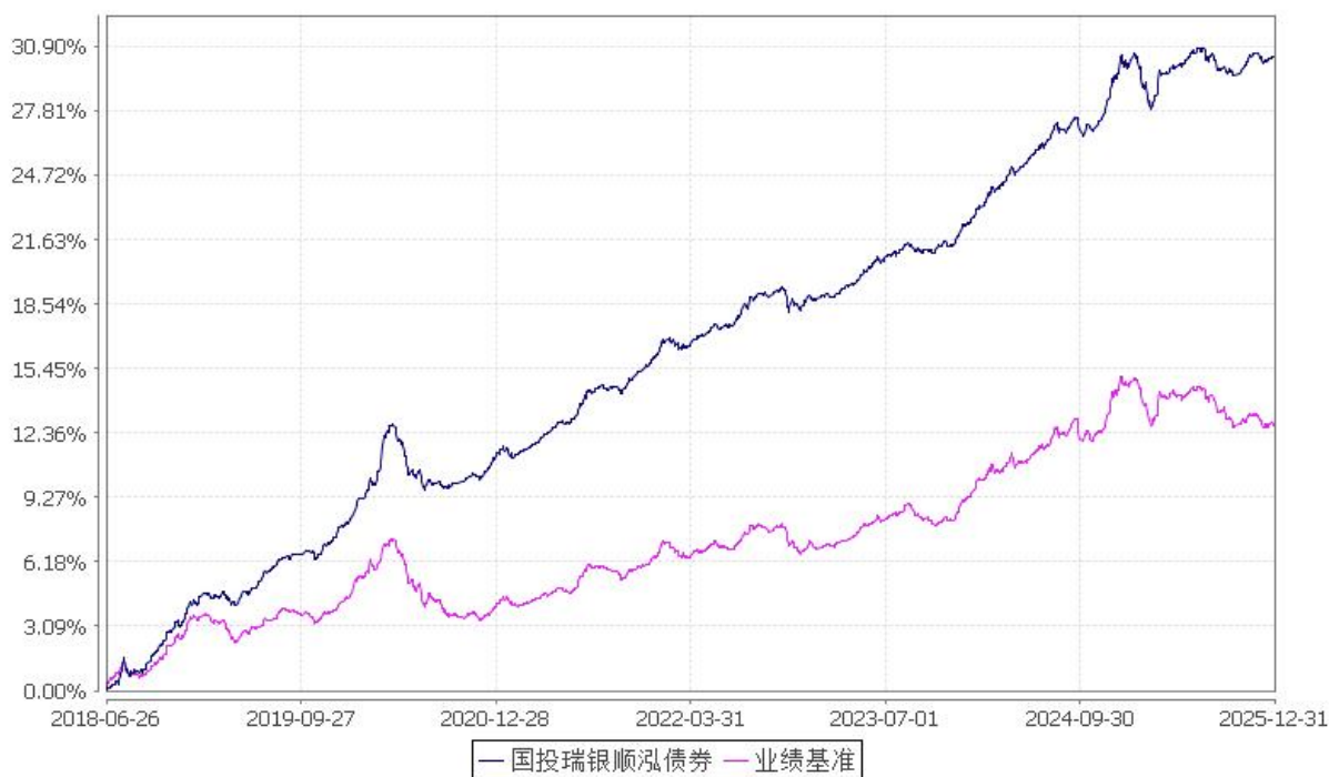
国投瑞银顺泓定期开放债券型证券投资基金 份额累计净值增长率与业绩比较基准收益率的历史走势对比图 (2018年6月26日至2025年12月31日)