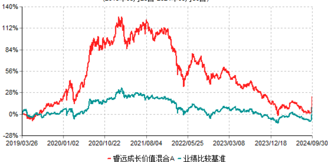
睿远成长价值混合A累计净值增长率与业绩比较基准收益率历史走势对比图 (2019年03月26日-2024年09月30日)